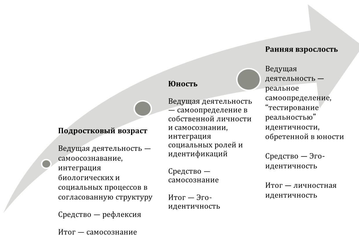
Рисунок 1. Структурно-динамические особенности периода вхождения во взрослость

переходит в новый «режим» развития – саморазвитие. На рисунке 1 представлена схема рассмотрения структурно-динамических особенностей периода вхождения во взрослость.